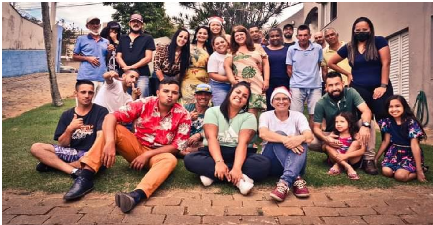
Convivência entre eles.

Almoço de Natal: Realizamos nosso almoço de natal com a participação e ajuda de toda a equipe, acolhidos e parceiros, em 18 de dezembro de 2021, este ano realizamos num espaço cedido pela Igreja Católica, devido ao triste episódio de incêndio que ocorreu no abrigo, não permitindo que o almoço ocorresse no mesmo, porém este episódio não tirou o brilho do evento, os acolhidos foram levados de ônibus ao local que generosamente uma empresa nos cedeu, almoçaram, realizamos brincadeira de amigo secreto com troca de presentes dando continuidade ao projeto de