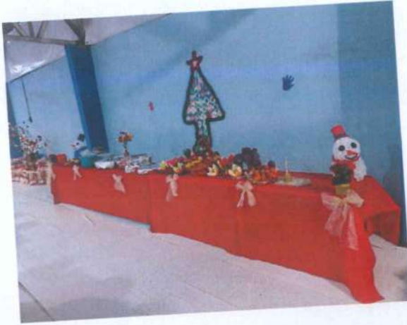
reparação do Jantar de Natal

PROGRAMA VOLTADO AO ACOLHIMENTO E REINserÇÃO SOCIAL DE PESSOAS EM SITUAÇÃO DE VULNERABILIDADE SOCIAL CNPJ: 20.004.071/0001-70